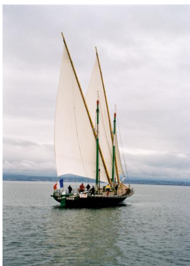
Savoie 513 navegando

El armazón ha sido realizado a la antigua, utilizando un abeto para la quilla, roble macizo para las varengas y cuadernas así como para los baos de cubierta. El forro ha sido realizado con alerce macizo, las tablas de la aparatadura tienen un grosor de 10 cm.